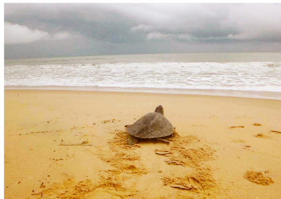
Tortue regagnant l'océan