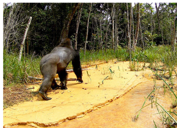
Gorille mâle à dos argenté observé par une caméra piège installée à 1 km du quartier général

Le Parc National de Conkouati-Douli est situé au sud-ouest de la République du Congo, à la frontière avec le Gabon, et couvre une superficie de 504 905 hectares . Il est aujourd'hui reconnu comme site Ramsar , et est inscrit sur la liste indicative du patrimoine mondial de l'UNESCO . Transfrontalier avec le Parc National de Mayumba au Gabon, les deux aires protégées forment un large bloc de 600 000 hectares d'habitats côtiers et marins uniques . Sa zone maritime (plus de 1 200 km 2 ) avec les lagunes et rivières, assure le renouvellement des stocks de poissons du Congo, permettant à un important secteur comme la pêche de fournir des emplois, de l'alimentation, et des revenus pour le pays.