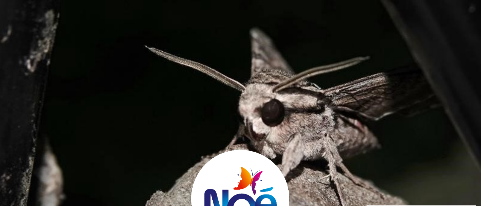
Sphinx du liseron