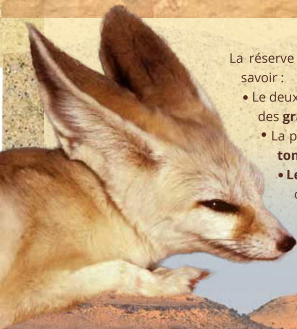
> Le fennec ( Vulpes zerda ), nommé aussi renard des sables du Sahara